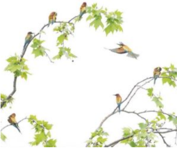
Gran Paradiso Film Festival 2023, cover catalogo tagliata.

La 26 ma edizione del Gran Paradiso Film Festival – in arrivo dal 24 luglio al 17 agosto nel Parco Nazionale Gran Paradiso – si preannuncia ricca di contenuti, articolati in un programma eclettico e ancora più esteso nel tempo, che quest'anno può vantare prime visioni nazionali, ospiti di grande rilievo