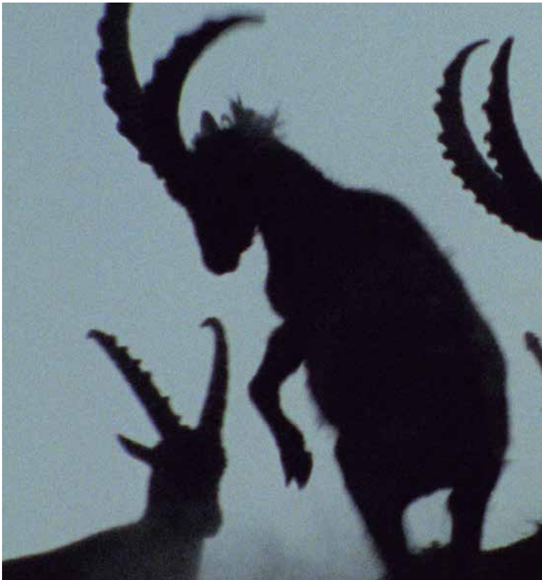
La danza tra terra e cielo- Cortometraggio vincitore del 24° Gran Paradiso Film Festival