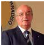
ITALO CERISE PRESIDENTE PARCO NAZIONALE GRAN PARADISO

Questa 25 ma edizione del Gran Paradiso Film Festival, si svolge nel centenario di istituzione del Parco Nazionale Gran Paradiso, è quindi un evento particolarmente importante per riflettere sui valori legati alla conservazione della straordinaria biodiversità che il Parco possiede, ma anche per la promozione e la conoscenza del suo territorio e della comunità umana che lo popola: un' occasione, questa, per raccontare quello che il Parco è diventato in un secolo di vita e come la sua azione, in particolare in questi ultimi anni, abbia inciso positivamente sullo sviluppo sostenibile del suo territorio.