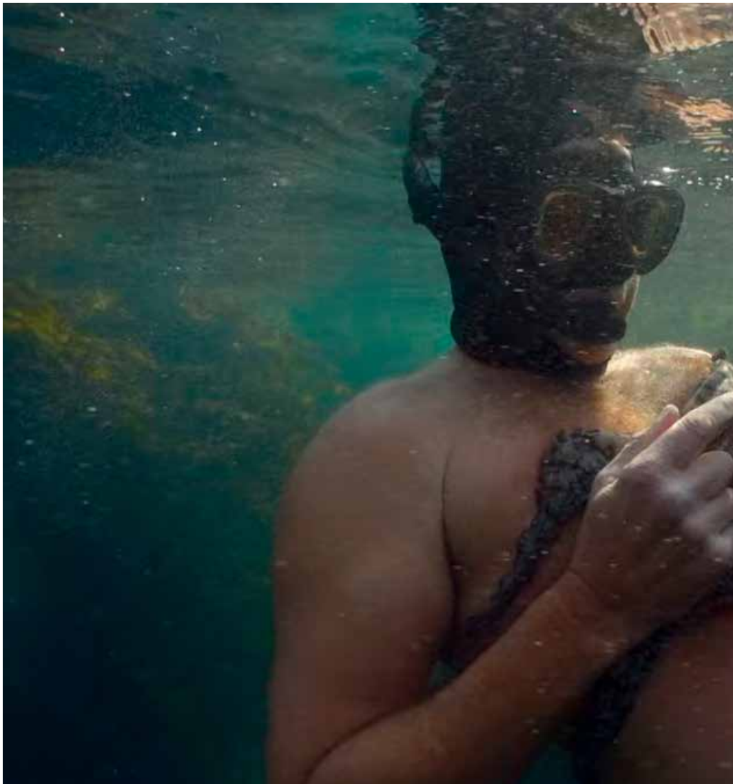
My Octopus Teacher - Film vincitore del 24° Gran Paradiso Film Festival